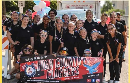
The High Country Cloggers