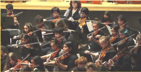
The Belgrade High School Orchestra